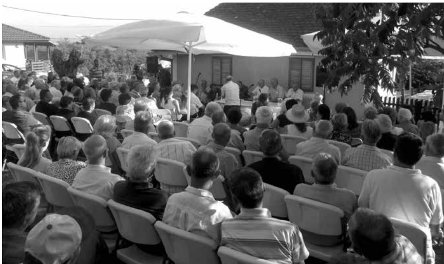
Са промоције у Поповићима

29 стигнемо Јужним Булеваром до Улице Максима Горког. Изађемо, и ево нас у његовом стану у Улици Генерала Хорватовића, пет минута од Аутобуске станице.