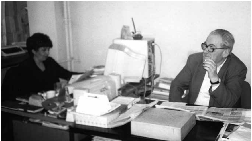
Васа у канцеларији

У Краљевачком позоришту био је управник – волонтер од 1970. до 1984. године. Основао је Пионирску и Омладинску сцену, Клуб љубитеља уметности, формирао библиотеку драмских дела, спровео реконструкцију зграде... У бројкама: 60 позоришних премијера, преко хиљаду изведених представа, толико и