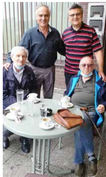
Скуп у доба короне

Дакле: завичај је мој. И људи из мог завичаја су моји. То је мој свет. Прави.