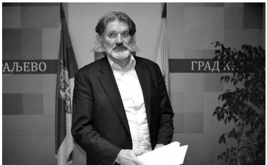
Милош у скупштини