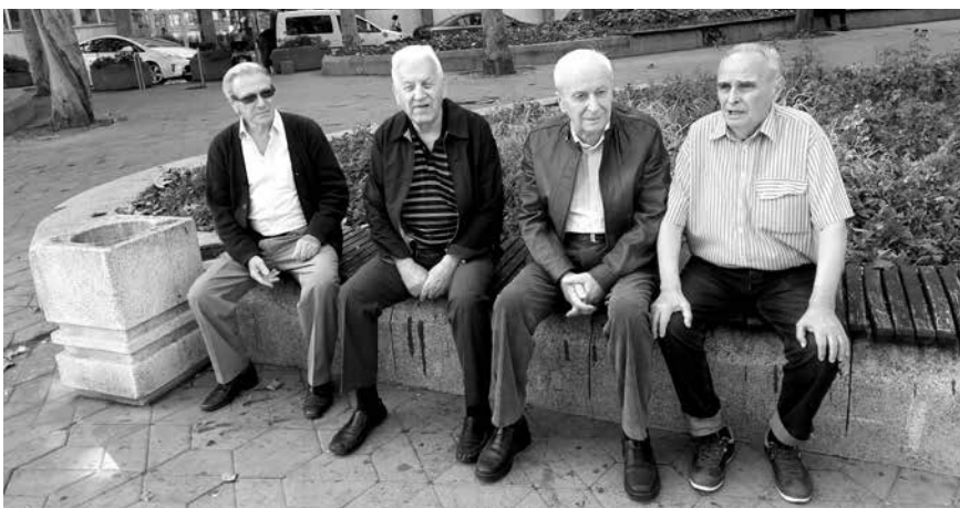
Они памте краљевачку амбасаду испред хотела Москва у Београду